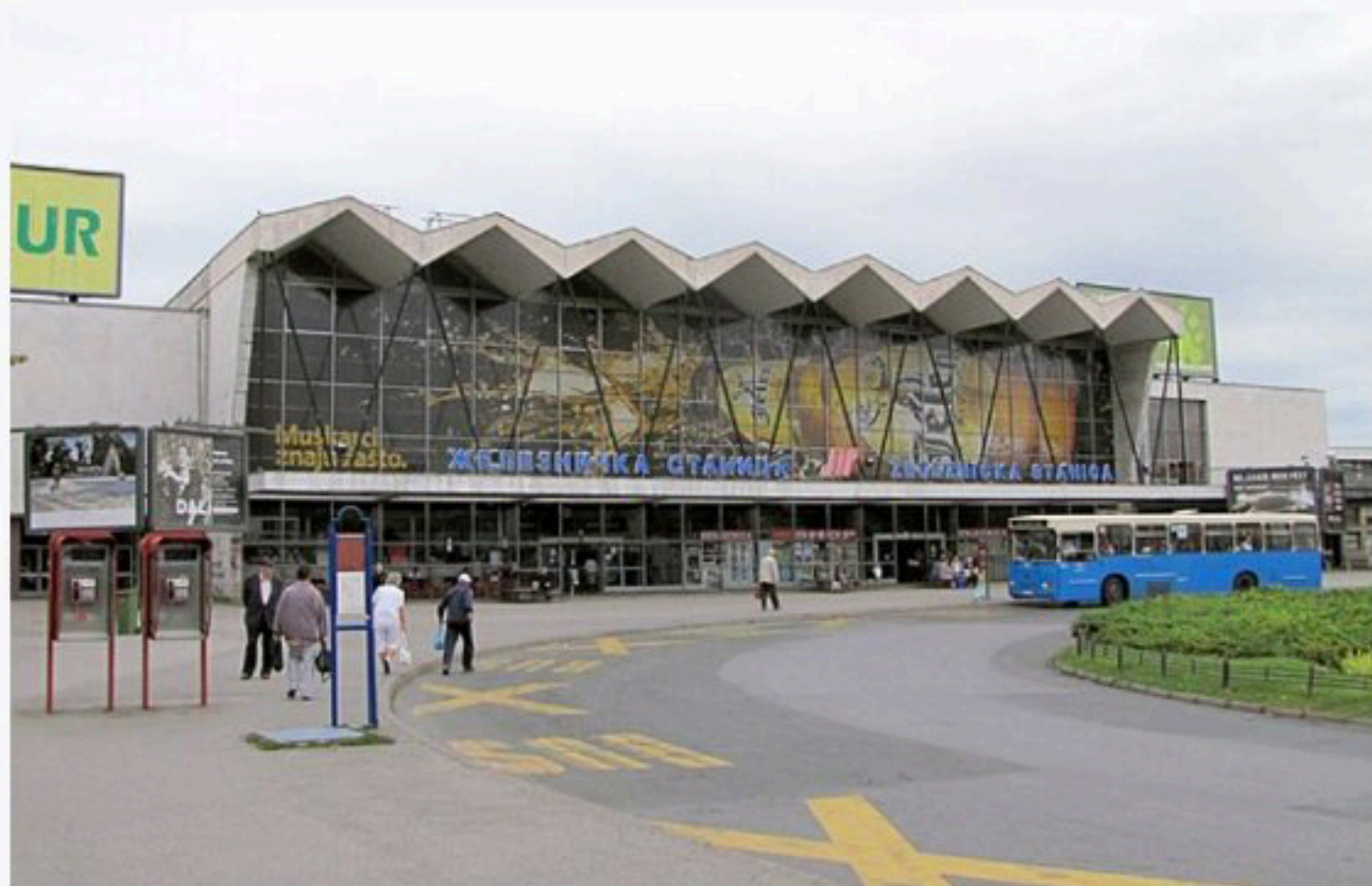
Glavni ulaz u stanicu